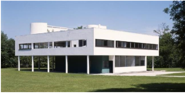
La villa Savoye