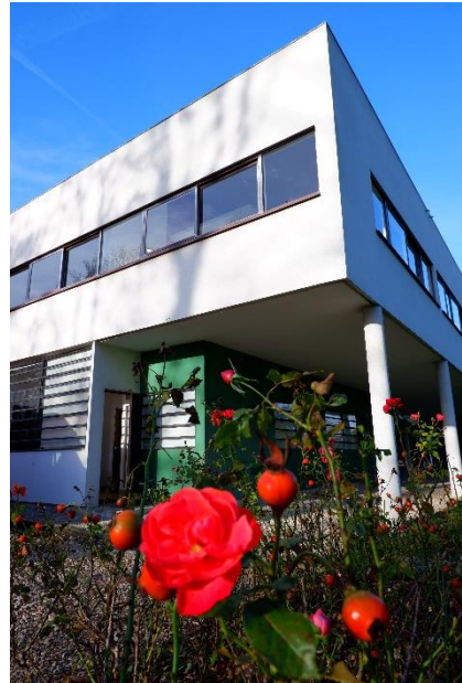
Printemps à la Villa © Chiara Zicari - CMN © FLC - ADAGP