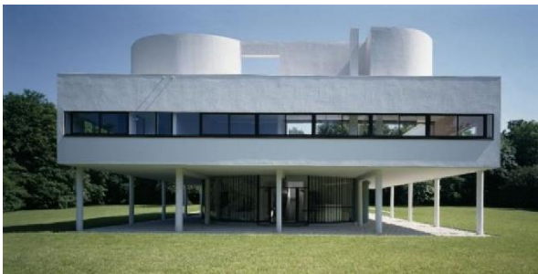
Façade nord-ouest © Jean-Christophe Ballot - CMN © FLC- ADAGP