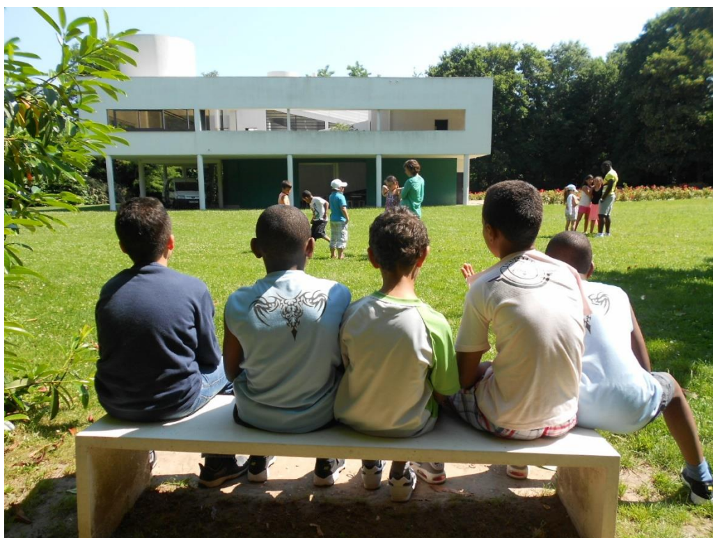
Villa Savoye, œuvre de Le Corbusier