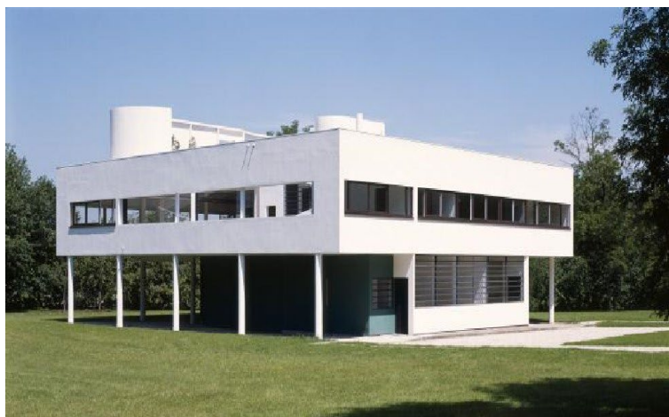
La villa Savoye

En 1928, Pierre et Eugénie Savoye demandent à Le Corbusier et son cousin Pierre Jeanneret de leur concevoir une maison de week-end. Le Corbusier vient de théoriser les cinq points d'une architecture moderne : les pilotis, le toit terrasse, le plan libre, la façade libre et la fenêtre en bandeau en deviennent les figures obligées. La villa Savoye et la loge du jardinier représente pour Le Corbusier l'aboutissement de plusieurs années de recherches.