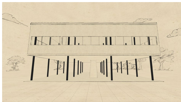
ArchiVR_15 © LucidRealities - Fondation Le Corbusier