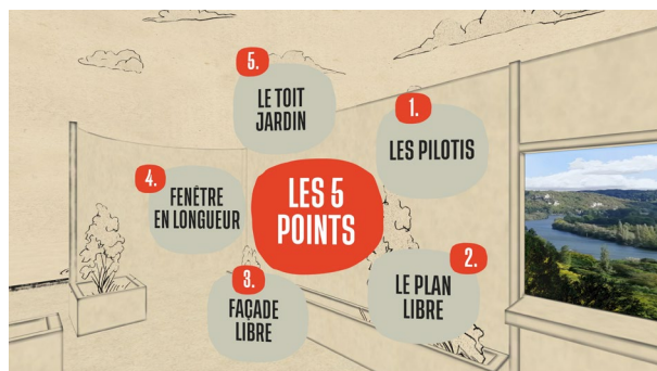
ArchiVR_24 © LucidRealities - Fondation Le Corbusier