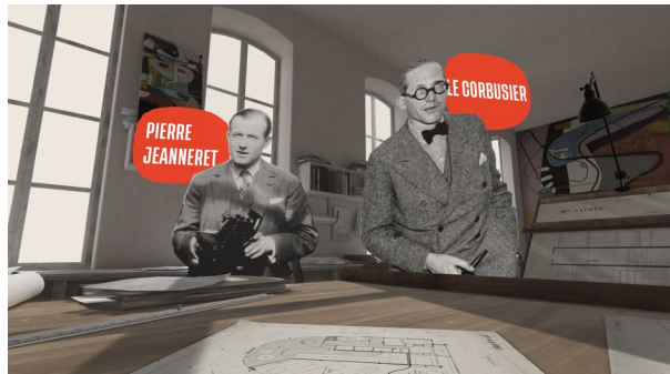
ArchiVR_25 © LucidRealities - Fondation Le Corbusier