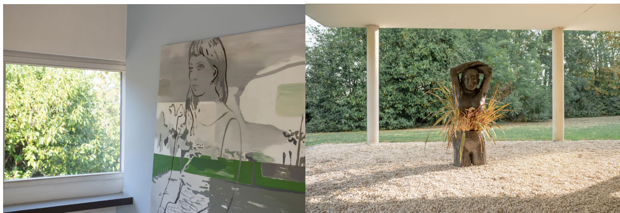
Habiter la villa de Françoise Pétrovitch © Le Corbusier et Pierre Jeanneret © FLC-ADAGP © Hervé Plumet, ADAGP

Cette exposition fera l'objet d'une publication aux Éditions du patrimoine dans la collection « Un artiste, un monument », reproduisant un texte de Pierre Yovanovitch et un entretien avec l'artiste.