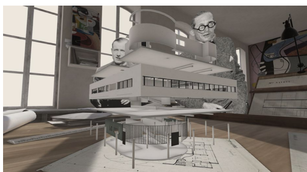
ArchiVR_36 © LucidRealities - Fondation Le Corbusier