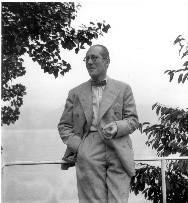
Le Corbusier © Fondation Le Corbusier

Créée en 1968 selon la volonté de l'architecte, la Fondation Le Corbusier, conformément à ses statuts et à ses missions, consacre l'ensemble de ses moyens à la préservation, à la connaissance et à la diffusion de l'œuvre de Le Corbusier, au travers des actions suivantes :