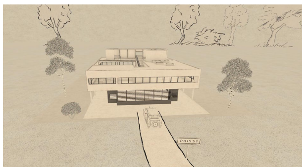
ArchiVR_05 © LucidRealities - Fondation Le Corbusier