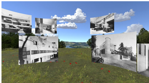
ArchiVR_09 © LucidRealities - Fondation Le Corbusier