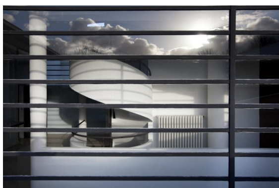
Verrière de la rampe © 11H45 – CMN © FLC - ADAGP