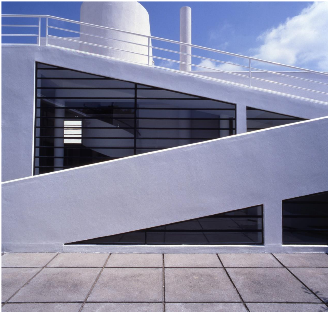
Villa Savoye à Poissy, œuvre de Le Corbusier ©FLC - ADAGP ©Jean-Christophe Ballot – CMN