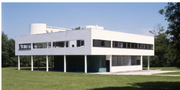
La villa Savoye

En 1928, Pierre et Eugénie Savoye demandent à Le Corbusier et son cousin Pierre Jeanneret de leur concevoir une maison de week-end. Le Corbusier vient de théoriser les acquis du Mouvement Moderne en « cinq points d'une architecture moderne. Les pilotis, le toit jardin, le plan libre, la façade libre et la fenêtre en bandeau en deviennent les figures obligées. La villa Savoye représente pour Le Corbusier l'aboutissement de plusieurs années de recherches formelles.