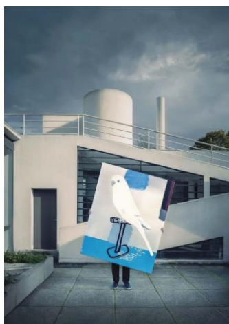
Françoise Péetrovitch, Sans titre, 2019 Le Corbusier et Pierre Jeanneret, villa Savoye