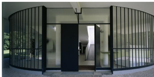
Hall d'entrée © Jean-Christophe Ballot – CMN © FLC - ADAGP