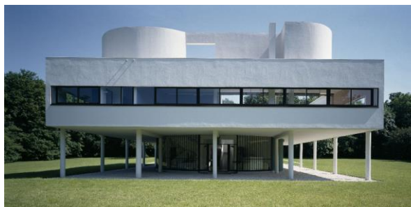
Façade nord-ouest © Jean-Christophe Ballot – CMN © FLC - ADAGP